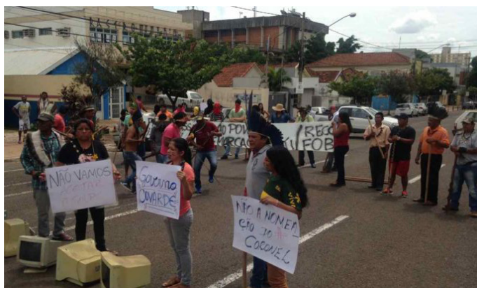
Contra 'Fundação Nacional dos Coronéis', Povo Terena completa uma semana de ocupação à sede da Funai

Saudamos a realização do 9.º Hanaiti Ho`únevo Têrenoe – A Grande Assembléia do Povo Terena, que ocorre neste mês de novembro em Aquidauana, Mato Grosso do Sul. O combativo Povo Terena está ocupando a sede da FUNAI, em Mato Grosso do Sul, contra a indicação de um coronel para dirigir o órgão, em mais uma das acintosas tentativas da gerência Temer de tentar intimidar a luta dos indígenas brasileiros por seu território sagrado e secular.