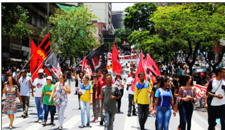
Operários da construção, professores e funcionários dos Correios participaram do dia Nacional de Lutas em BH, 11/11/2016

Conclamamos a participação de todos os movimentos de luta camponesa para participar das mobilizações do próximo dia 25 de novembro de 2016, sexta-feira. O que está acontecendo no Rio de Janeiro vai ser “fichinha” perto do que acontecerá na grande maioria das pequenas cidades do Brasil se aprovados os pacotaços da gerência ilegítima, entreguista e vende-pátria de Temer. A tão propalada “reforma da previdência” mira principalmente em acabar com a aposentadoria rural, um dos pouquíssimos avanços da Constituição de 1988 que foi aplicado reconhecendo uma injustiça histórica e secular, em que pese servir para esconder a semi-feudalidade, o trabalho escravo e a concentração da terra (a maior do mundo) pelo latifúndio. As pequenas cidades, a grande maioria já quebradas, vão afundar, pois a maior parte da renda destas, do dinheiro que circula nelas que passa pela mão do povo e pelo comércio, vêm da previdência rural. Além disso, estes pacotaços pretendem aumentar a exploração dos trabalhadores da cidade e do campo, acabar com os serviços públicos básicos da educação e saúde (que já são péssimos, o que o povo paga de imposto teria que receber um serviço mil vezes melhor). Estes pacotaços pretendem tirar dinheiro dos pobres para pagar a roubalheira e a corrupção dos ricos, para tentar salvar o capitalismo burocrático no Brasil e o imperialismo no mundo desta crise colossal que só pode ser resolvida com revolução.