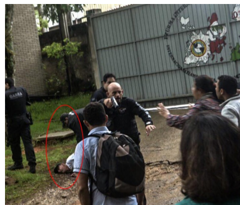
Garra de São Paulo ataca escola do MST, 04/11/16