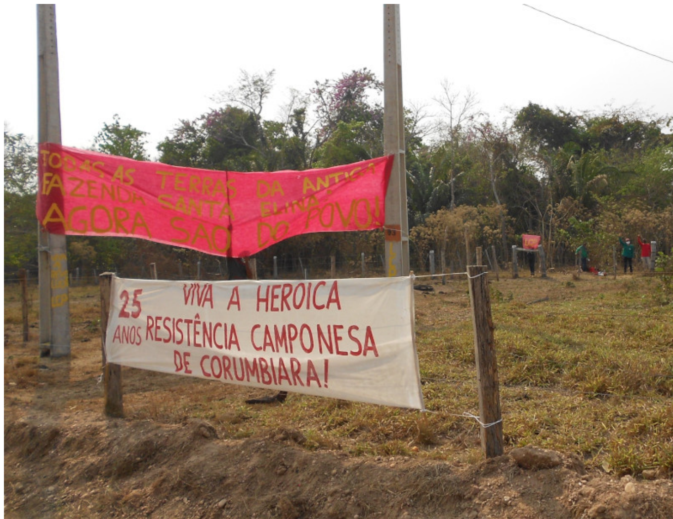
Faixas estendidas ao lado da entrada do Acampamento Manoel Ribeiro

Com mais de 3 semanas de ocupação do latifúndio Nossa Senhora Aparecida, o Acampamento Manoel Ribeiro tem recebido todos os dias mais e mais famílias em busca de trabalho e moradia. Todas elas têm sido orientadas sobre as medidas de prevenção contra o novo coronavírus através da ação do Comitê Sanitário de Defesa Popular conformado pelos próprios camponeses da ocupação.